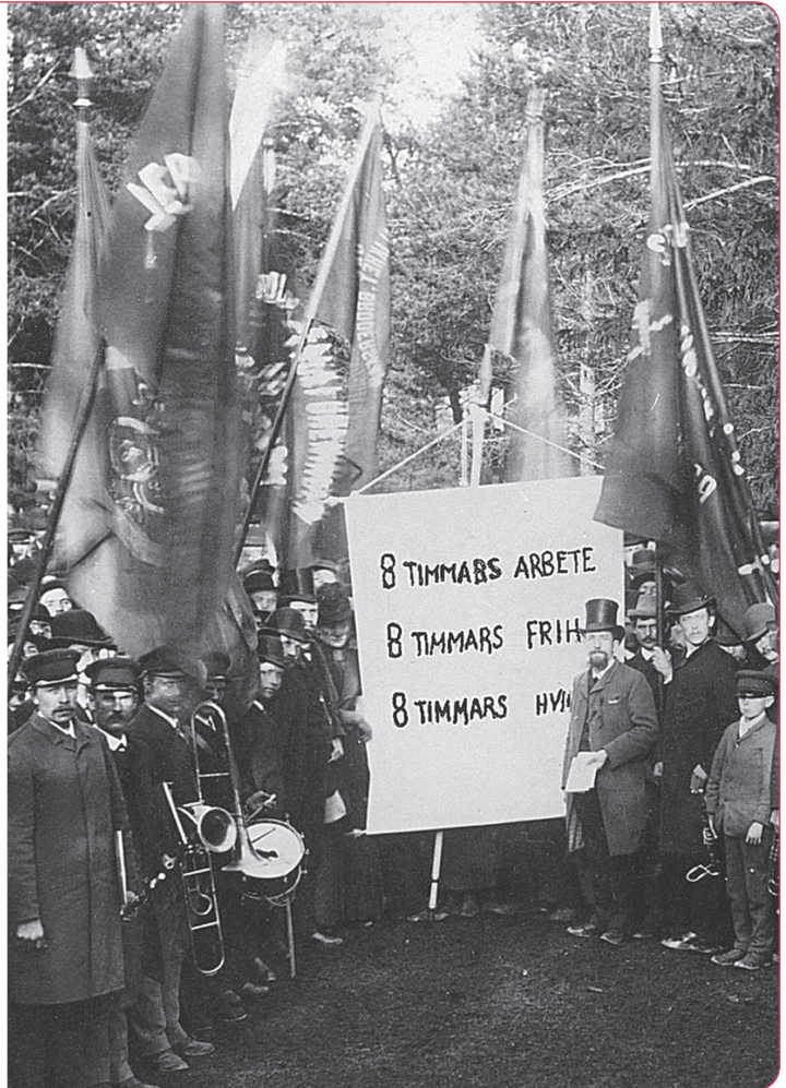
Arbetare i Sundsvall demonstrerar för åtta timmars arbetsdag år 1890. Det infördes i Sverige år 1919.

I början av 1900-talet uppstod idrottsrörelsen , hyresgäströrelsen och på 1970-talet kom miljörörelsen som är ett samlingsnamn för flera miljöorganisationer.