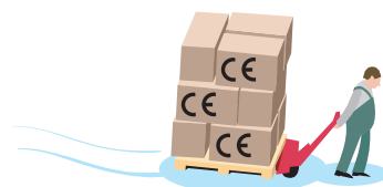
Fri rörlighet för varor

Reglerna för EU:s inre marknad och den fria rörligheten gäller förutom de 27 medlemsländerna också i några länder som EU har skrivit avtal med. Dessa länder är Island, Norge och Lichtenstein.