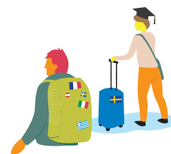
Fri rörlighet av personer