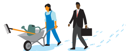
Fri rörlighet för tjänster