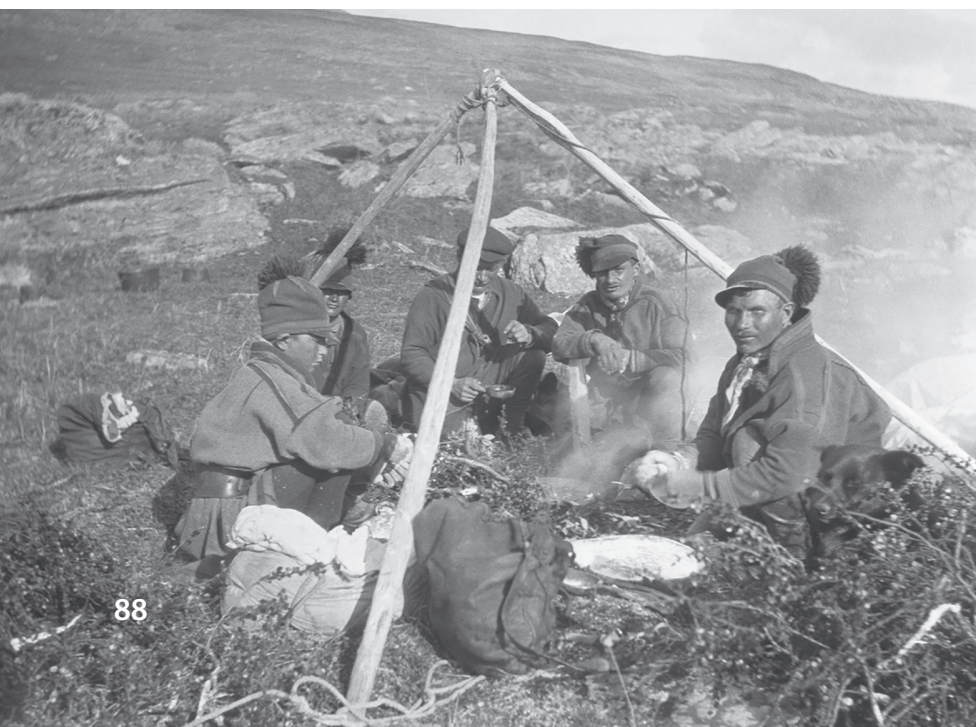
Samer bakar gáhkku, samiskt tunnbröd, vid lägerelden på en fjällhed, 1926.

Många samer var nomader som levde av renskötsel. Det betyder att de var jägare och fångstfolk som flyttade efter årstid och fångstsäsong. När renhjordarna vandrade till nytt bete följde människorna efter. Samerna bodde i kåtor, det vill säga bostäder som såg ut som tält. En del samer blev också bofasta och arbetade med jordbruk, boskapsskötsel och fiske.