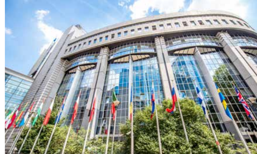
Utanför EU:s byggnad i Bryssel hissas alla medlemsländers flaggor.