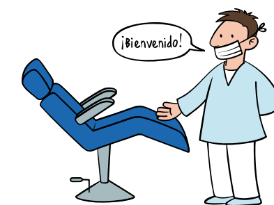
Tack vare överenskommelser i EU kan en spansk tandläkare välja att arbeta i Sverige.