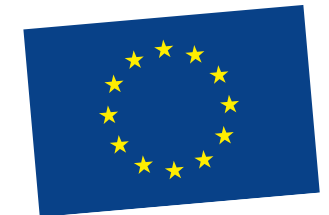
EU-flaggan består av tolv stjärnor i en cirkel.

Länderna i EU samarbetar bland annat genom att ha gemensamma regler för handel, jordbruk och miljöfrågor. EU har gjort det lättare för människor att resa, arbeta och studera i olika länder. Flera av EU-länderna har även en gemensam valuta , euro.