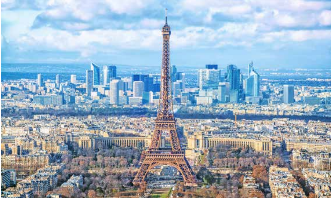
Paris är en av Europas störstäder.