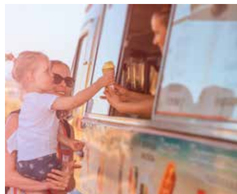
Turism är när människor reser för att koppla av eller för nöjes skull.

De arbeten som ökar mest är tjänsteyrken, som till exempel arbeten på kontor, i butiker och restauranger. Till tjänsteyrken räknas också arbeten med transporter, turism och it .